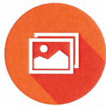
Photo Attachments let's your friends & family share special moments and occasions with you.

Los Mensajes son conversaciones digitales cortas, y una manera realmente fácil de platicar con sus seres queridos.